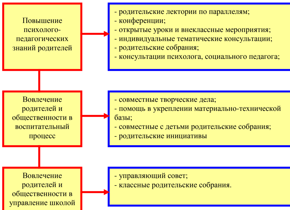
Схема взаимодействия семьи и школы

В целях повышения уровня воспитательной работы школа сотрудничает со всеми заинтересованными организациями и учреждениями города, а также с представителями общественности и может быть представлена схемой (см. схему взаимодействия).